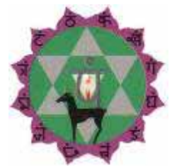
Mandala van het hartchakra

Hier is de overeenkomst tussen de kristalstructuur van een sneeuwvlok en de mandala van het hartchakra zichtbaar gemaakt.